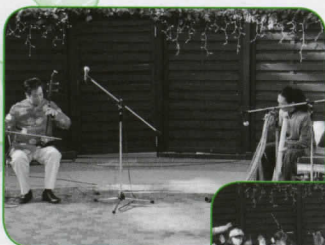
◀中国の伝統楽器・二胡とオーストラリア先住民の楽器・ディジュリドゥの希少なコラボ演奏