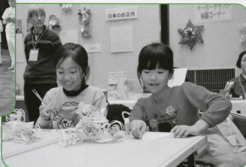
▲折り紙で作るパロル。クリスマスデコレーションにぴったりです