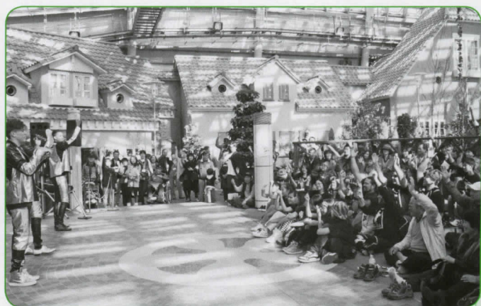
▲ハーフ・ミックスのボーカルユニット「No Side」はブラジル、イタリア、アルゼンチン、ペルー、ギニアなどさまざまな国をルーツに持つメンバーです。彼らの歌とメッセージに、会場の雰囲気がひとつになりました