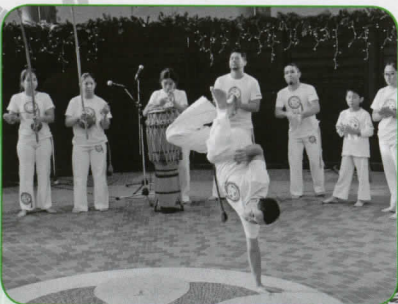
▲ブラジル武道・カポエイラ