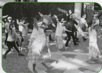
▶フィリピン舞踊の華麗なステップを見た後で、多くの参加者が「アヒル・ダンス」にチャレンジ

「ワールド・フェス安城」は、安城市に住む外国人籍住民の出身国の多いブラジル、フィリピン、中国をはじめ、さまざまな国に興味を持っていただき、異文化理解を促進することを目的に開催しました。ステージ・イベントでは、出演者はもちろんですが、観客も外国籍の方が多く、ステージに飛び込みでダンスをしたり、さまざまな言語が飛び交う中、いつものデンパークのステージとは違う雰囲気で、たいへん盛り上がりました。