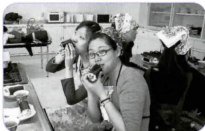
▲恵方を確認してから、丸かぶりしよう！