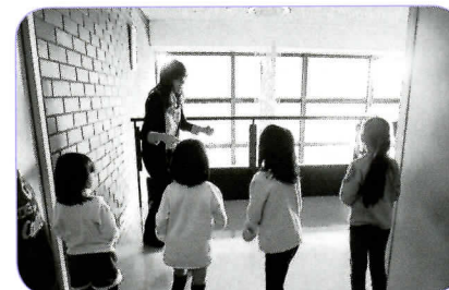
▲いよいよエッグハンティング・ゲームです。特別な「ゴールデン・エッグ」を見つけよう。