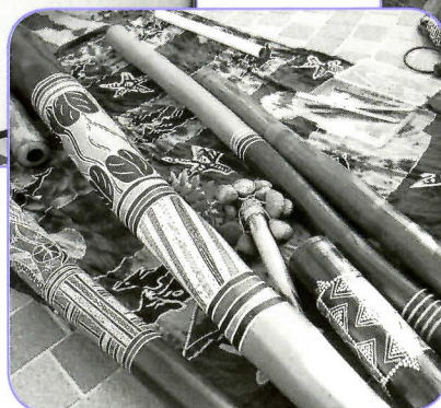
▲オーストラリア先住民族の楽器 ディジュリドゥ