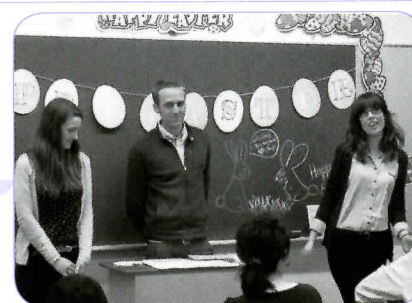
▲講師の出身であるアメリカとイギリスの家庭でのイースターの様子を聞きました。