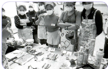
▲まず、巻き寿司の具材を作ります。七福神にちなんで7種の具材を準備しました。