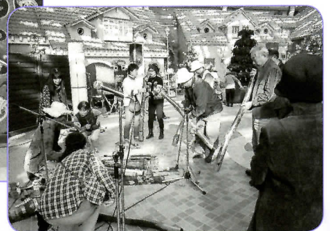
▲吹き方体験では、コツを教えてもらいながら、 上手く音を出せる人が続出