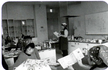
▲防災に関するお話の後、非常持ち出し品を確認しあいました。