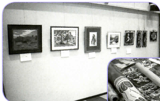
▲姉妹都市からの絵画や ほうろう細工