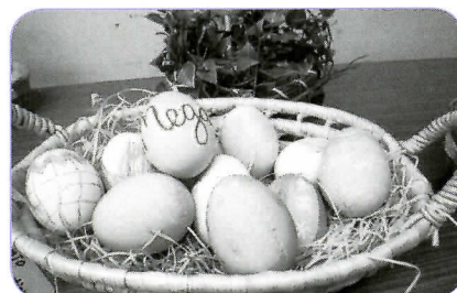
▲ゆで卵の殻に描いたイースターエッグ。参加者ひとりひとりの個性が出ています。