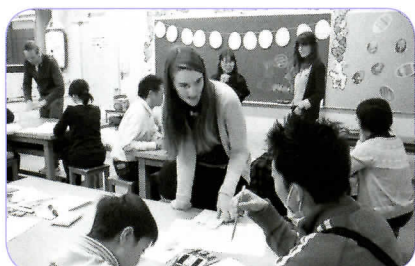
▲ Let's have fun together!

今年のイースターは4月20日ですが、少し早いイースターを親子で楽しみながら異文化に触れました。