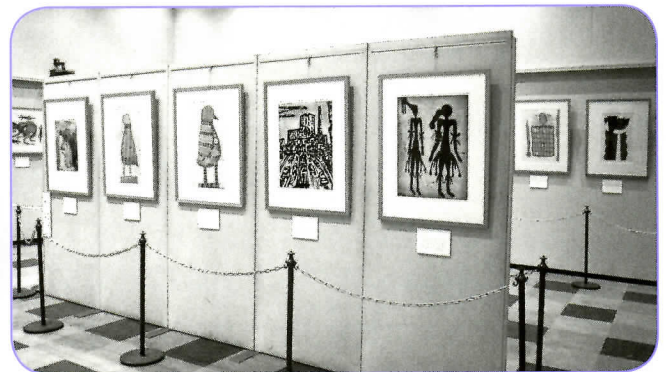
▲アボリジニ作品の版画。「作品は、ビクトリアをはじめとするオーストラリア各地の特徴ある自然や風土、多文化社会で受け継がれてきた伝統などを幅広くご紹介できるよう厳選されたものです。<2010年6月・ビクトリア州首相ジョン・ブランビー氏のコメント>」

開催中は約1200人もの方に来場していただきました。オーストラリアの歴史や文化を感じていただけたのではないのでしょうか。