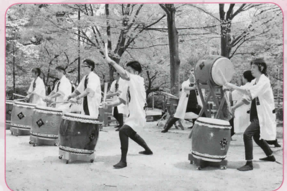
▲安祥太鼓による和太鼓パフォーマンス