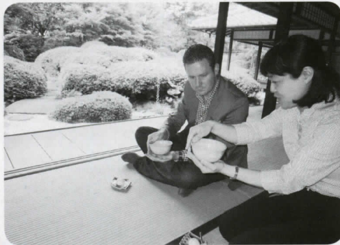
▲丈山苑で抹茶を体験するモーガン議員