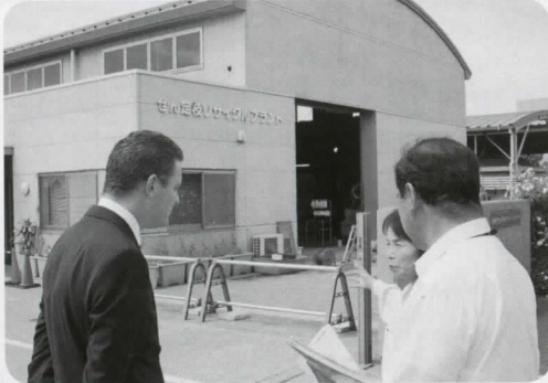
▲リサイクルプラザとせん定枝リサイクルプラントを視察