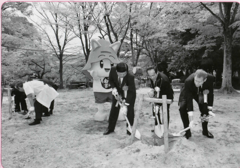
▲南吉サルビーもお手伝い