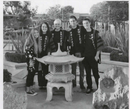
▲アメリカに帰国してから、ハンチントンビーチ市議会議場にて多くの市民の前で帰国報告をしました。思い出の七夕まつりハッピーを全員で着ました。ハンチントンビーチ市役所に設置してある安城市から贈られた石灯籠の前で