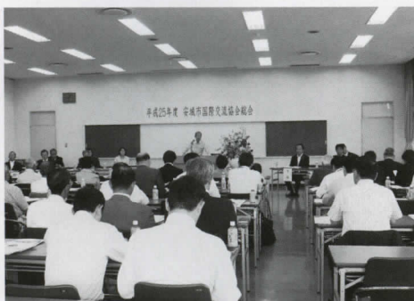
5年度 安城市国際交流協会総会