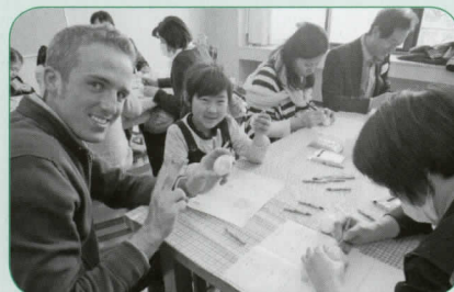
ゆで卵を使ってイースターエッグを作ります。この作り方の良い点は、絵を描いた後で卵を食べられることですね。