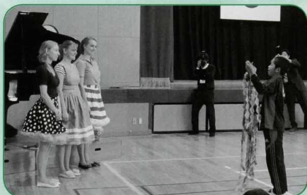
西部小学校の児童から千羽鶴のプレゼント