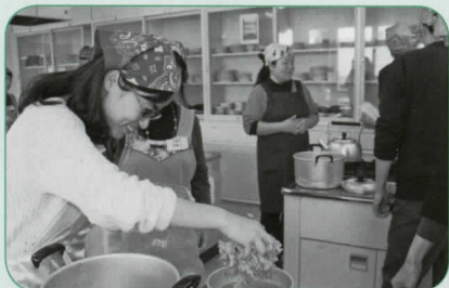
日本料理の基本、かつおだしのとり方の実習です。

炊き込みご飯とけんちん汁の作り方と、料理の過程で出るごみの分別とリサイクルについて学びました。