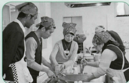
ごぼうのさがきをします。ごぼうやこんにゃくなどを初めて調理する人が多かったようです。