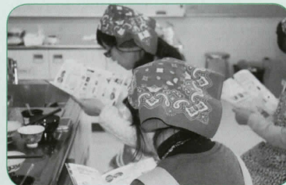
ごみ減量とリサイクルについての説明をしながらごみ分別を確認しました。