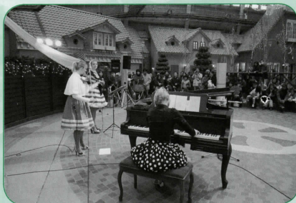
デンパーク内フローラルプレイスでのコンサート。北欧の美しい民族音楽にうっとり