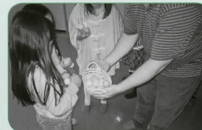
さあ、エッグハンティング・ゲームを始めましょう!