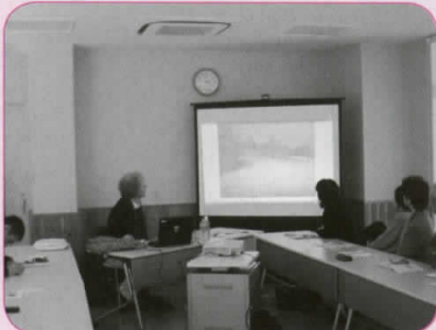
今冬は雪が多かったチチェスターの風景

イギリス出身の講師によるイギリスの日常生活や文化の講座。講師の家があるイギリス南西部チチェスターの風景や暮らしが紹介されました。また、講師秘伝の「DUNDEE CAKE」のレシピとともに、参加者全員でケーキ作りに協力した後は、試食と紅茶で楽しみました。