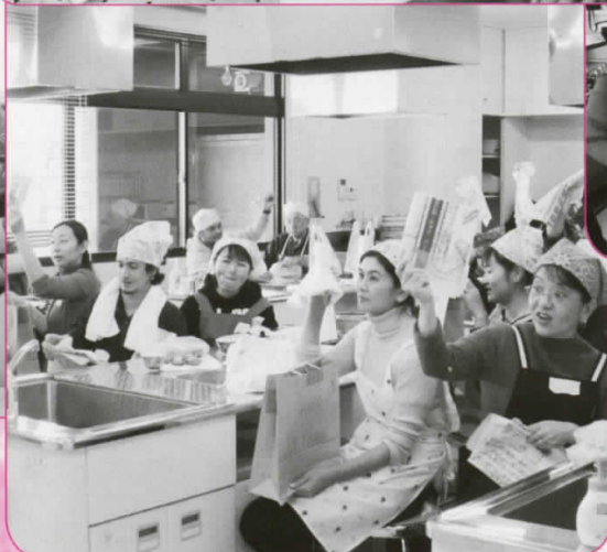
おいしくいただいた後は「ごみ分別クイズ」