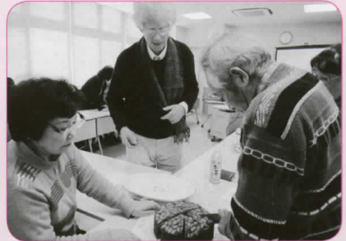
ケーキの表面はアーモンドで飾り、中にはたくさんのドライフルーツが入った、どっしりとしたダンディーケーキです