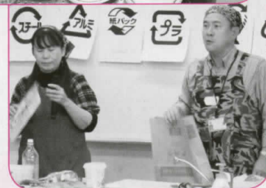
雑紙の分別を初めて知った方が多かったようですね