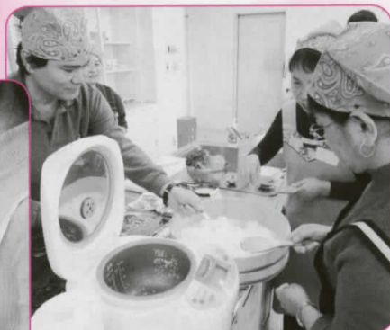
合わせ酢を混ぜて、酢飯を冷まします