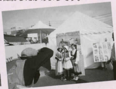
デンマーク民族衣装を着てパネルの前でポーズ