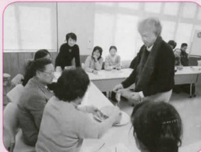
さあ、皆さん協力してケーキを作りましょう