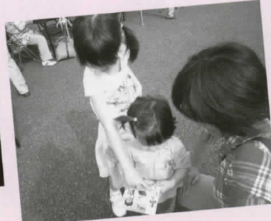
写真が出来上がりました