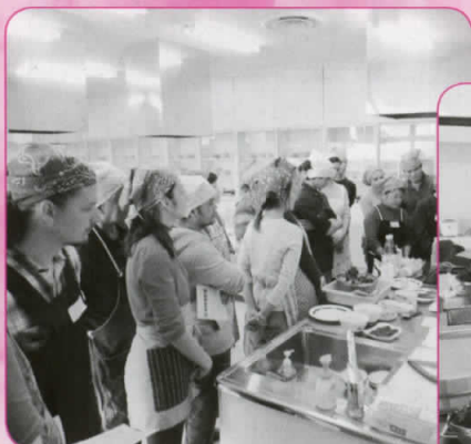
まずは厚焼きたまごから作りましょう

今回の日本料理教室は「巻き寿司」。厚焼きたまごに初めてチャレンジする人や、まきすを見るのが初めての人もありました。ごはんを多く入れすぎてかなり太い巻き寿司になってしまうこともありましたが、全員2本ずつ巻いた結果は、とてもおいしそう！おいしくいただいた後の片付けは、ゴミの分別についてクイズを交えて確認し合いました。