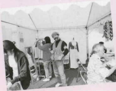
私が本日のカメラマンです！

今年はデンマーク民族衣装の試着体験を開催しました。市広報係とのコラボレーションで、デンマーク姉妹都市コリング市の街並みを背景に写真を取り、「広報あんじょう」の表紙レイアウトに仕上げ参加者へプレゼントしました。写真を見ると、まるでデンマークで撮影したかのようです。