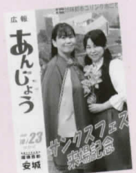
パネルとは思えない臨場感のある風景の広報あんじょう特別号でした