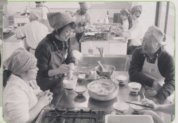
なべを囲んで、自然に笑顔がこぼれます