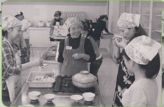
かつおぶしとこんぶから取っただしのお味は？