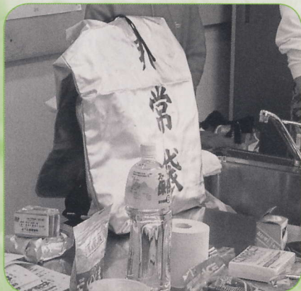
非常持ち出し袋の中身をみんなで確認