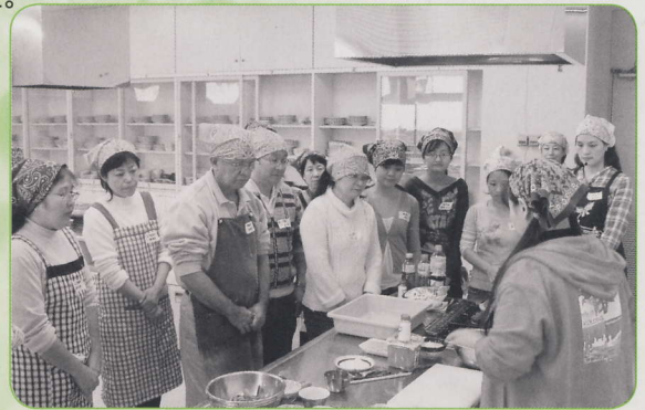
まずは寄せ鍋の材料について説明します