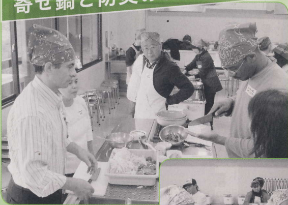
豆腐をくずさないように切ります