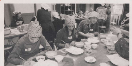
メモを取る人やビデオで記録する人もたくさんいました