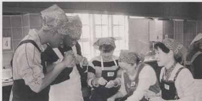
えびの背わたをとります