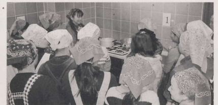
かつおぶしからダシをとります