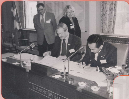
▲2009年1月21日 正午 コリング市庁舎にて協定書に 署名をするアナセン市長と神谷市長