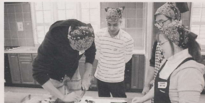
野菜の切り方が少し難しいです