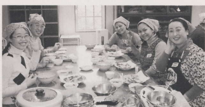
からっと揚がった天ぷらはおいしいね