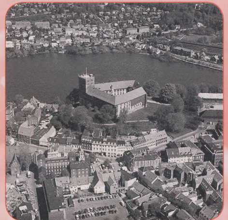
▲13世紀に建設されたコリングフース城を中心に広がる市街地

1997年、文化・産業の交流をするために友好都市提携を結んだコリング市と安城市。以来、デンパークを拠点とした文化交流や、音楽学校や博物館同志の交流などが盛んに行われましたが、環境などデンマークから学ぶことも多く、デンマークに対する市民の関心の高さから、今後は人的交流も含めた幅広い交流を行うことを目的に、「姉妹都市」として改めて協定を結びました。