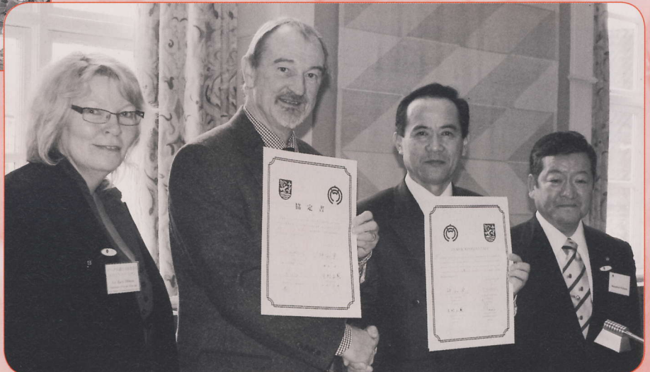
▲向かって左から、エベッセン副市長、アナセン市長、神谷市長、木村市議会議長