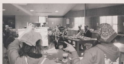
リサイクルするプラはこの黄色のゴミ袋で～す