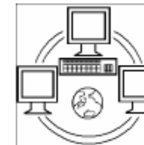
たげんごたいおう 多言語対応インターネット